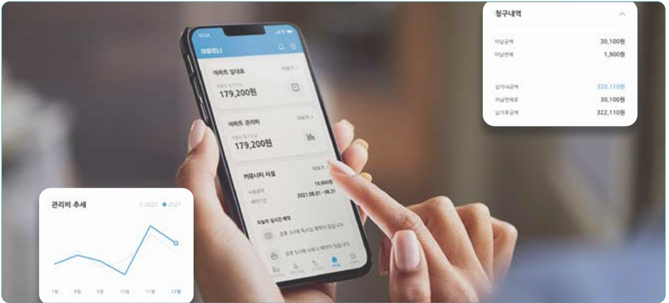
▲입주민이 앱을 이용하여 모바일 고지서로 관리비를 조회하고 있다.

스마트 공동주택 통합 관리는 가정에서의 삶의 질과 편의성을 개선하고, 보안을 향상시키며, 에너지 사용 등 관리 효율을 높일 수 있다.