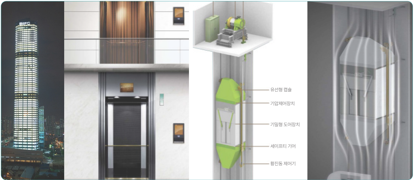
▲ 초고속 엘리베이터의 '유선형 캡슐 케이지'는 운행소음을 최소화 한다.

초고속 엘리베이터는 입주민의 건물 내 이동 시간을 단축하여 생활 편의를 향상시키고, 에너지 효율 시스템을 적용하여 운영 비용을 절감할 수 있다.