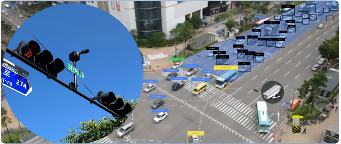
▲ 스마트 교차로 시스템이 교차로를 이용하는 차량을 식별하여 교통량을 분석하고 있다.

스마트 교차로는 시간대별로 변화하는 교통량을 자동 검지하고 혼잡도를 평가하여 최적화된 교차로 신호를 운영하여 원활한 교통 흐름을 가능하게 한다.