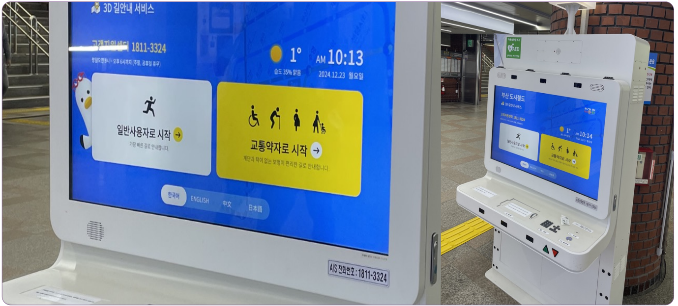
▲부산시 지하철역에 설치된 배리어프리 키오스크가 교통약자에게 길안내 서비스를 제공하고 있다.

키오스크의 외형과 구동을 배리어 프리 방식으로 표준화하여 장애, 성별, 연령 등에 관계없이 서비스에 대한 접근성을 제고할 수 있다.